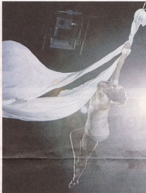
Urbanatix steht für akrobatische Spitzenleistungen: Ob auf der Matte, am Vertikalseil oder am Mast. Die Akteure fliegen durch die Jahrhunderthalle.